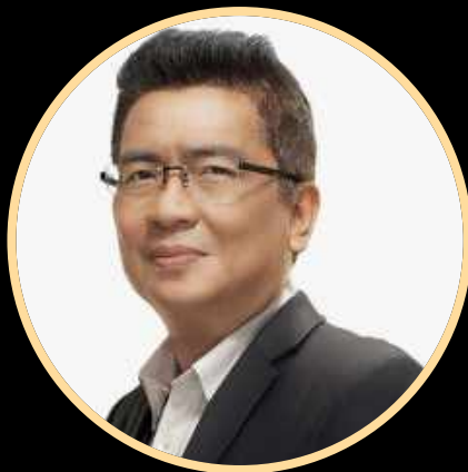
Helmy Yahya Dewan Komisioner