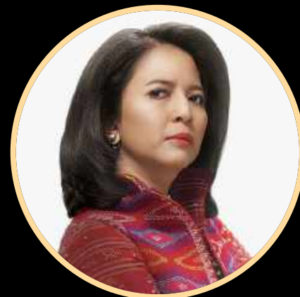
Antarina SF Amir Dewan Komisioner

Public figure yang juga merupakan pengusaha sukses di Indonesia. Pengalamannya di bidang entertainment dan juga entrepreneur , berhasil membuat Helmy Yahya menjadi Presenter, Produser, Pengusaha dan Dosen yang handal.